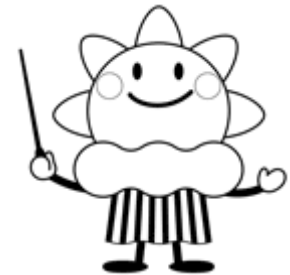
気象庁マスコット キャラクター はれるん