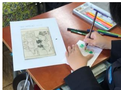
(中)『一筆画譜』 すみだ北斎美術館所蔵